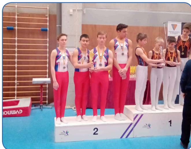
L'equip P4, subcampió de Copa Catalunya