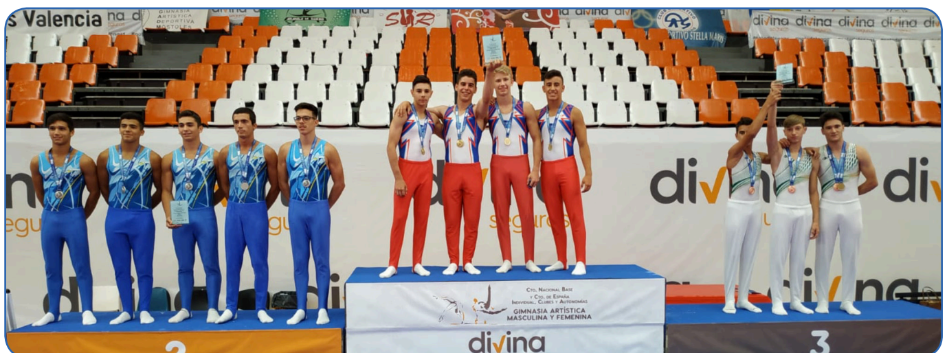
L'equip B6, campió d'Espanya