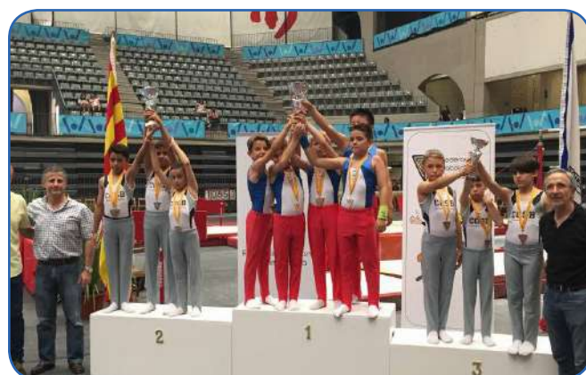
Equip nivell 2, medalla d'or al Català de Granollers