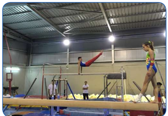
Es converteix en Centre de Detecció i Perfeccionament' (CEDIP)