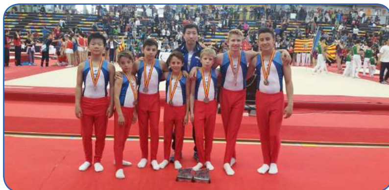
Els equips de N2 i N3, subcampions d'Espanya per Clubs